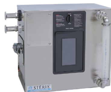
過酸化水素ガス除染/滅菌装置VHP M10