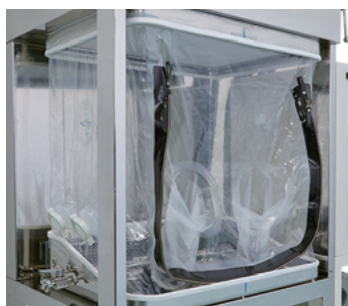
フレキシブルエンクロージャー部 (搬出入用気密ジッパー付)