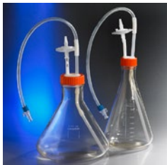
三角フラスコクローズド システム、オス MPC (カタログ番号 431518、 431520)