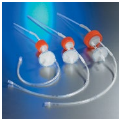
トランスファーキャップ、 MLL (カタログ番号 431444、 431446、431448)