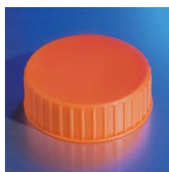
431363 フラットキャップ