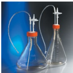
三角フラスコクローズド システム、MLL (カタログ番号 431512、 431514)