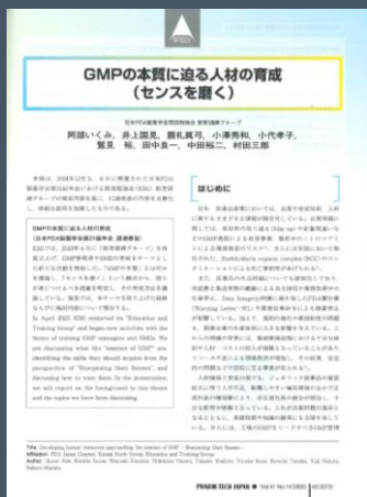
※ガイドブック見開き2ページイメージ

インターフェックスでの出展製品・サービスの【技術論文】【ホワイトペーパー】などの テキスト、画像をご準備いただき、弊社でレイアウトをしまして 【冊子版ガイドブック】と【ファームテクONLINE】でご掲載いたします。