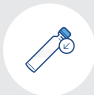
クロージャー組付