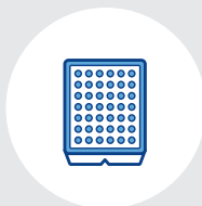
ネスティング タブ挿入、 トレーローディング