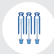
シリコニゼーション