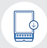
シーリング バッグ詰め