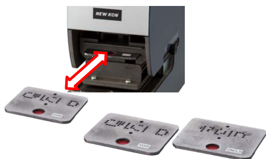
【キープレートの交換】