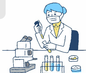
製薬企業 (品質管理・品質保証部門)