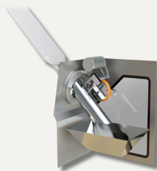
10度トランスファー