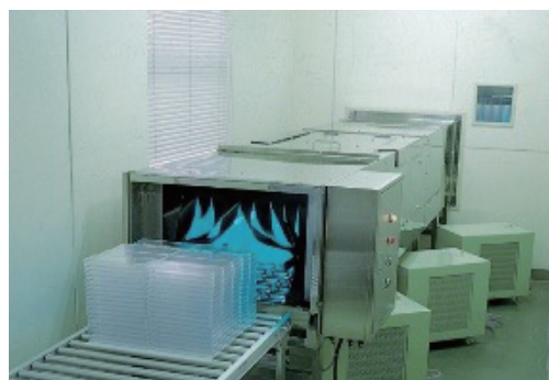
製品名 高出力表面殺菌装置 (資材のクリーンルーム搬入時の両側面、上下照射による外装の除染)