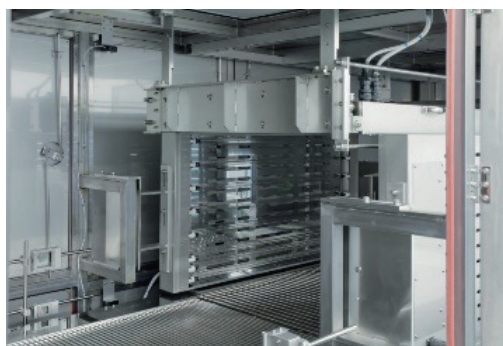
製品名 中出力表面殺菌装置 (点眼薬容器資材入り袋両側面、上下照射による外装の除染)