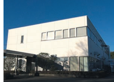
株式会社アイロムグループ殿 ウイルスベクター製造施設