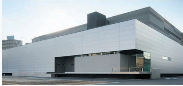
住友ファーマ株式会社殿向け 再生・細胞医薬製造施設 (SmaRT)

お客様のニーズに基づいた提案型設計や実績に基づいた設備設計は620件を超え、近年では、下記のようなバイオ医薬品製造施設においても実績があります。