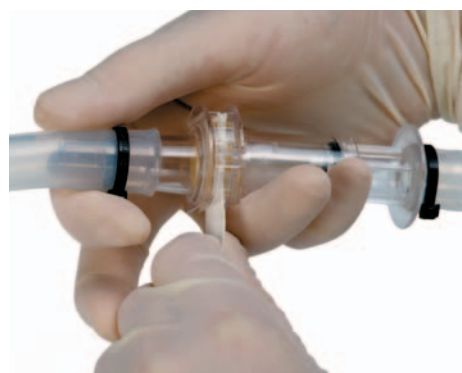
クリーンパック・コネクター