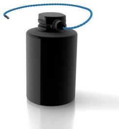
オートクレーブ&フリーザー対応 30Hロガー(-90~+140°C)