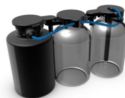
自動入出庫対応 凍乾製品温度測定システム LyoTrain (-60~+85°C)