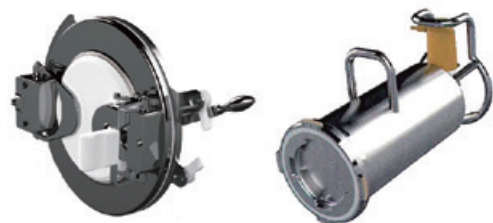
Gloveless Alpha Port

このαポートは、人間工学に基づいた完全な操作コントロールを実現しています。FDA21CFRおよびUSPクラスVIに準拠して開発されています。