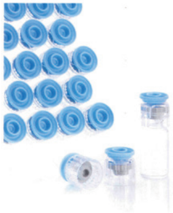
大成化工 SNAP ON CAP