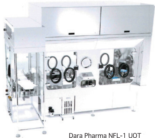
Dara Pharma NFL-1 UOT